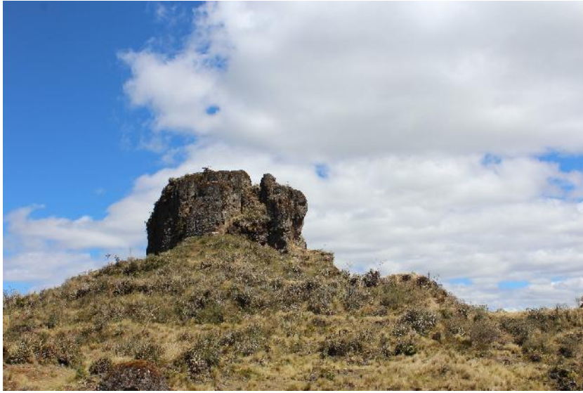
Fotografía 01. Fortaleza el Castillo.