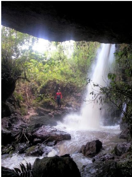
Fotografía 06. Caída de agua y cueva catarata la Paccha.