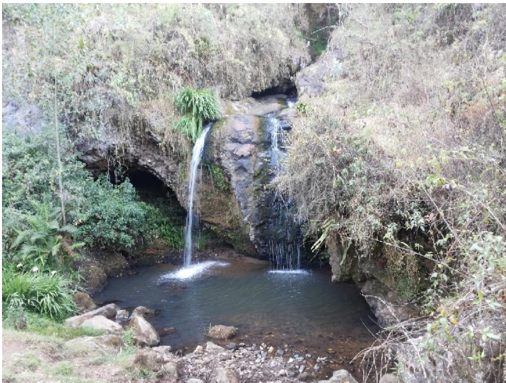
Fotografía 10. Caída de agua Catarata La Piriana.