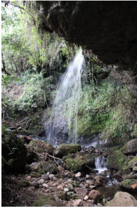
Fotografía 05. Caída de agua y cueva catarata la Paccha.