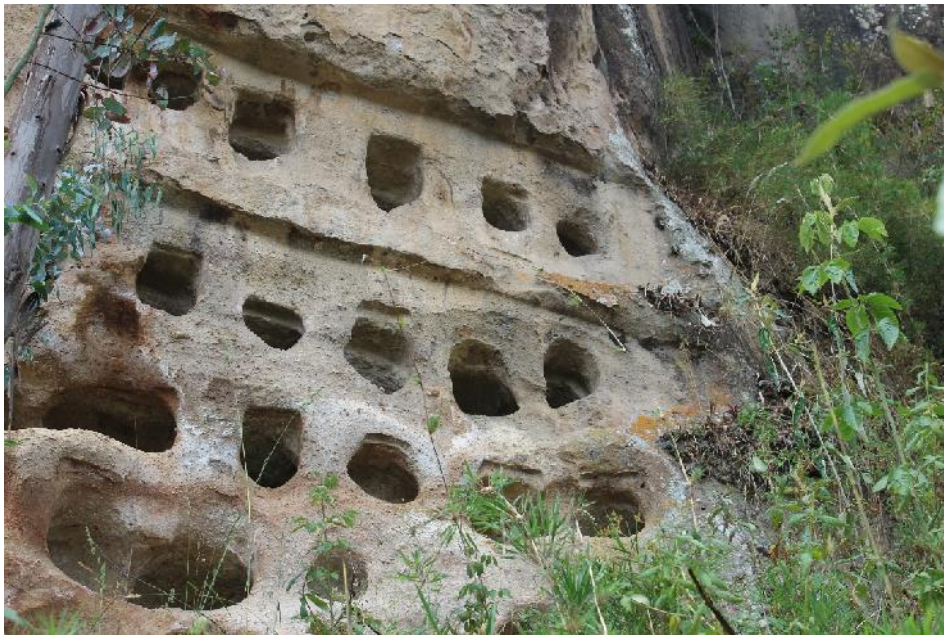
Fotografía 12. Ventanillas El Molino.