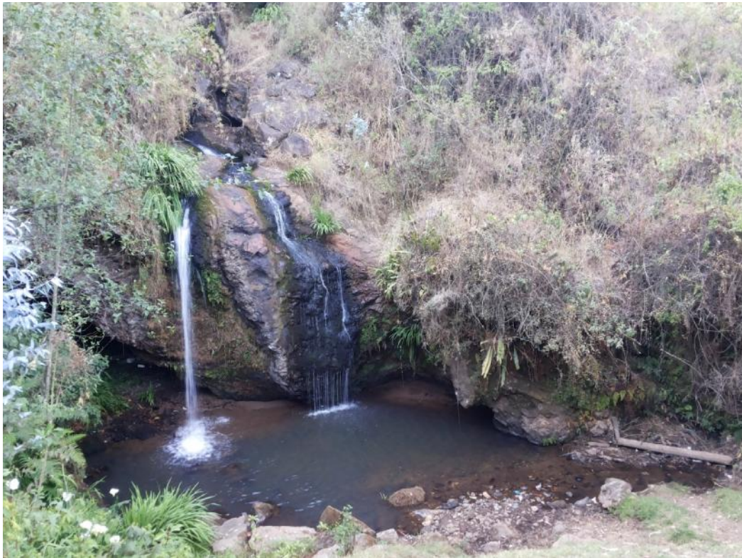
Fotografía 09. Caída de agua Catarata La Piriana.