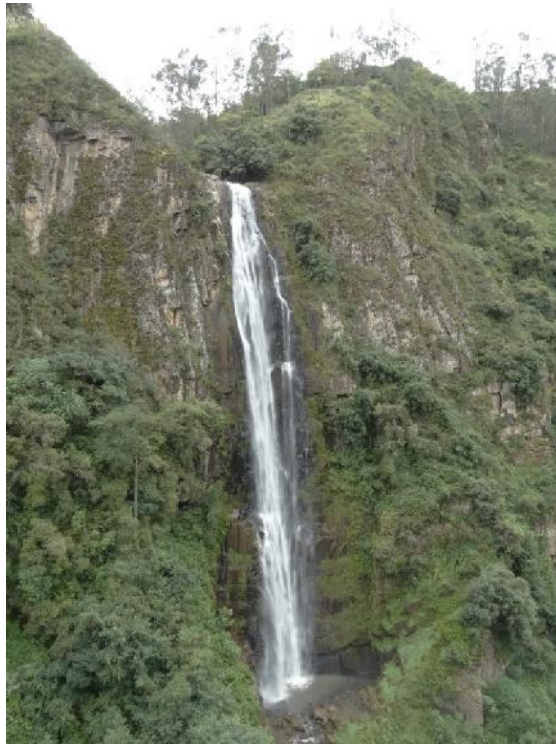
Fotografía 08. Caída de agua Catarata El Condác.