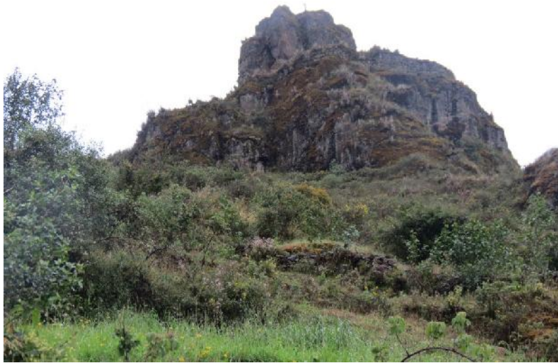
Fotografía 02. Fortaleza el Castillo.