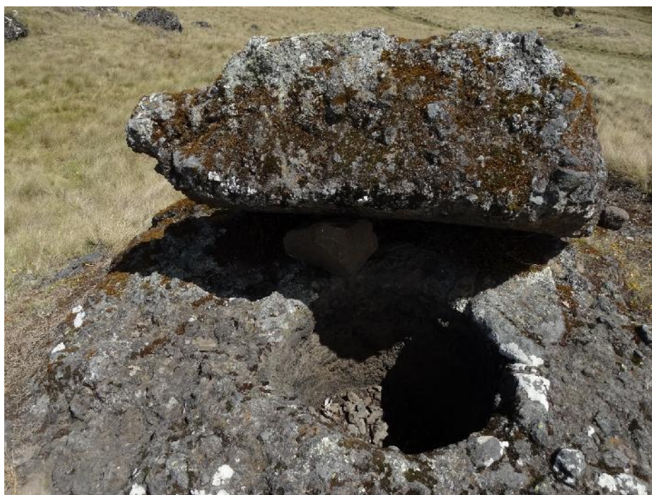
Fotografía 04. Tinajas de la Fortaleza el Castillo.