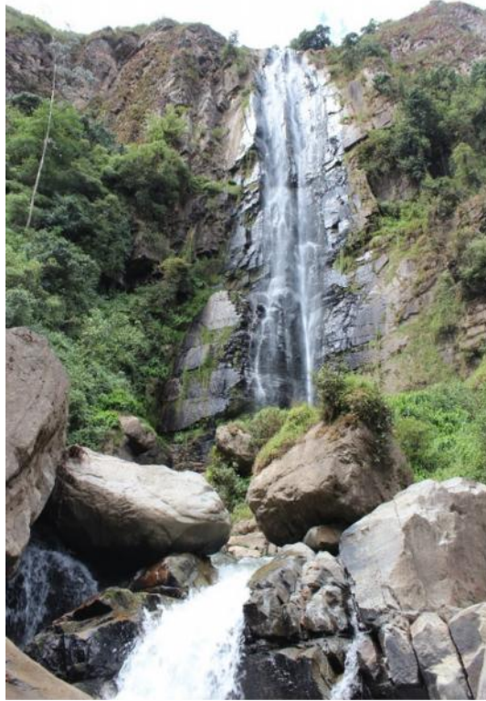
Fotografía 07. Caída de agua Catarata El Condác.