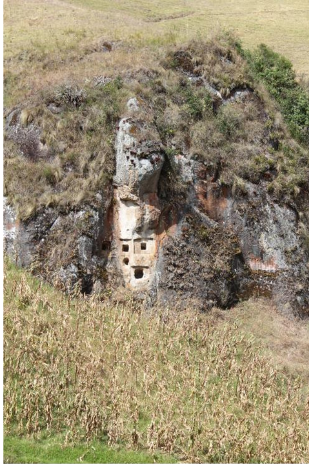
Fotografía 13. Ventanillas El Molino.