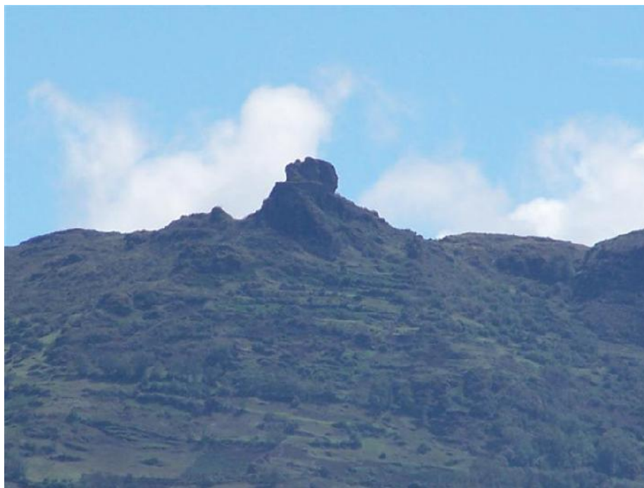
Fotografía 03. Fortaleza el Castillo.